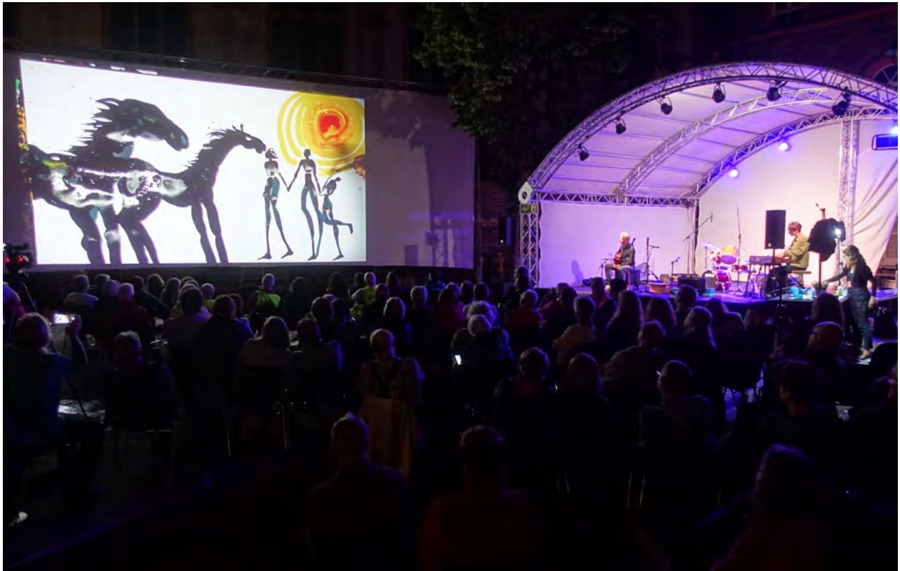
Momentmalerei-Performance 'Augenblicke/Aufzeichnungen', 2023

Heimat Europa Filmfestspiele, Simmern, Hunsrückmuseum