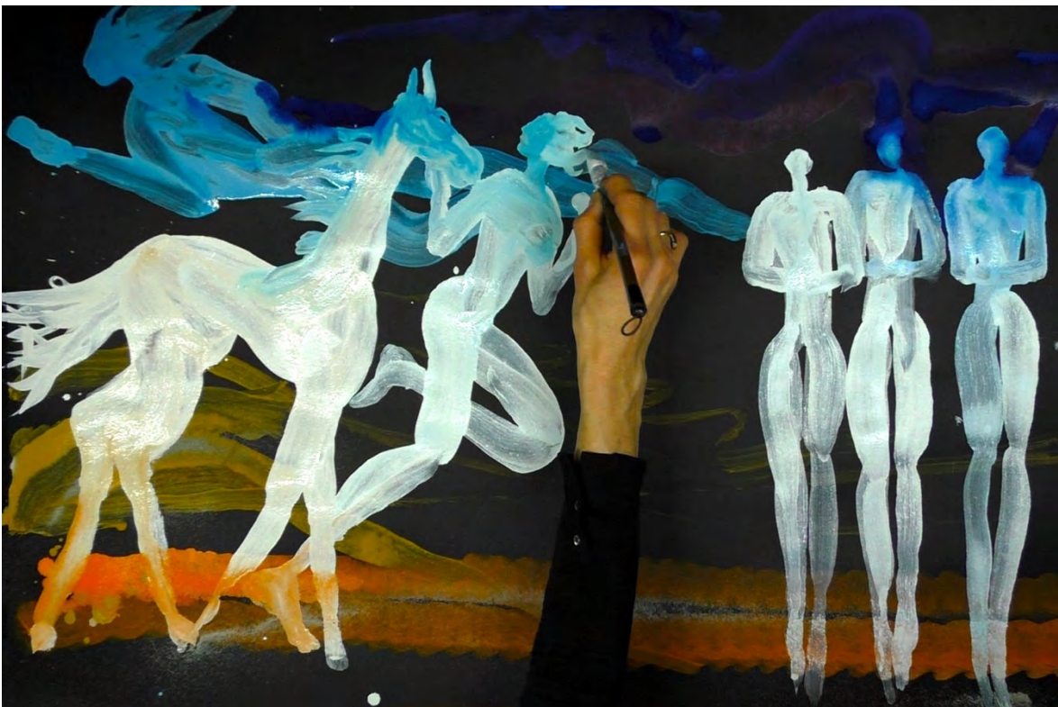
ARCHAIC TENDERNESS, Momentmalerei, 2025 57 x 100 cm, Pigmente auf Hahnemühle Passepartout Karton