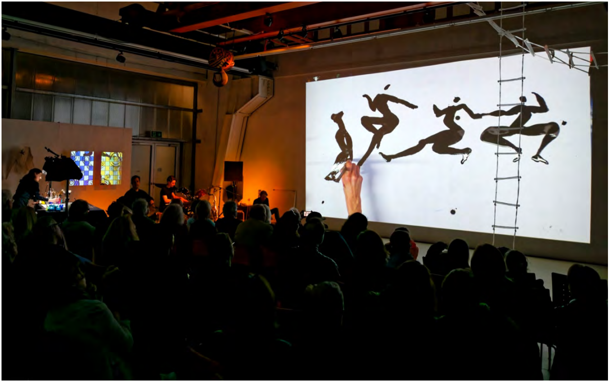
Momentmalerei-Performance PORTAL, 2023, halle50