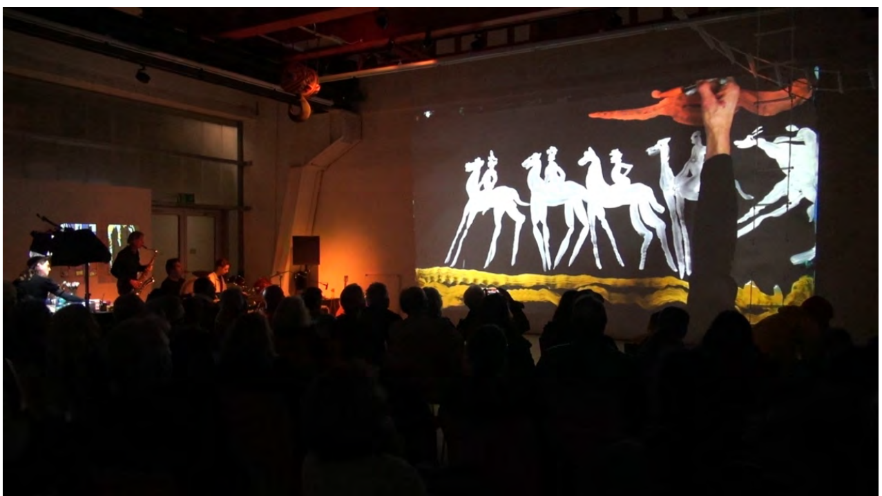
Momentmalerei-Performance PORTAL, 2023, halle50

Musik: Ludger Bartels, Frederick Verbeek von Loewis