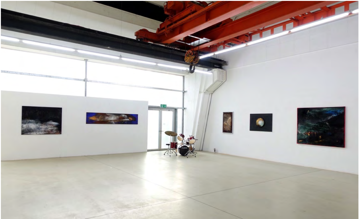
Ausstellung in halle50, Städtisches Atelierhaus am Domagapark, München