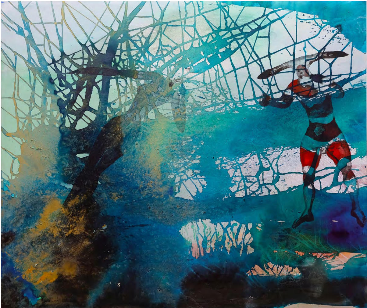
ShiftingRealms, 135x160x6 cm, Pigmente, Tusche, Sand auf Leinwand